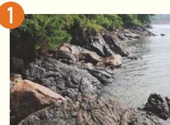
1 太崎観音崎付近の地層

鹿児島湾奥や桜島を望む場所に、安土桃山期に百引から移設されたと伝わる観音が安置されています。ここでは鹿児島県本土の基盤をなす四万十累層群の黒色泥岩や砂岩が観察でき、この地層が深海に堆積した証拠となる堆積構造を見ることができます。江戸期、牛根は硯石の産地でした。